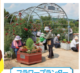
フラワープランター