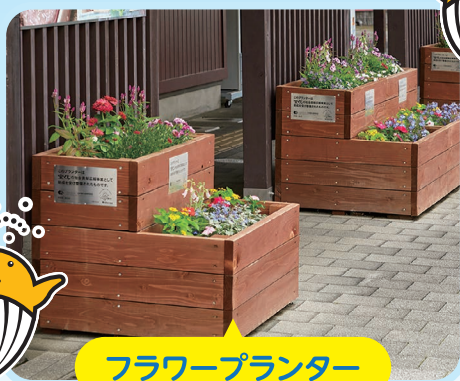
フラワープランター