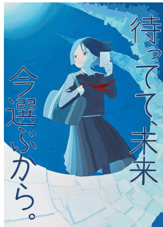
令和7年度明るい選挙啓発ポスターコンクール 文部科学大臣・総務大臣賞 (高校1年生)