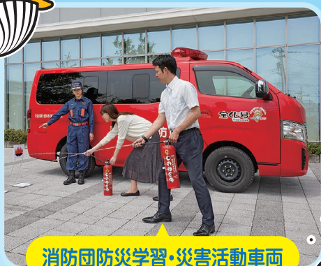
消防団防災学習・災害活動車両