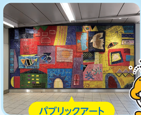
パブリックアート