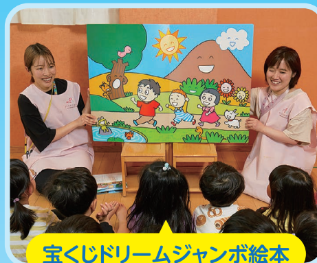
宝くじドリームジャンボ絵本