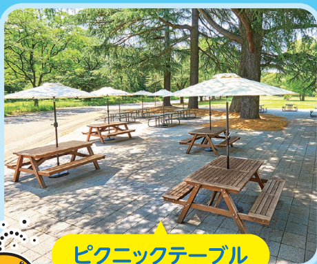
ピクニックテーブル